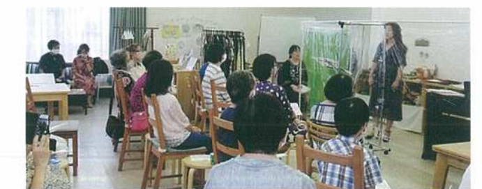
「おのみこなみ」での音楽会

であれば自宅等から参加が可能になります。そして参加の移動時間、交通費、会場費がかからないことは利点です。オンラインの強みを活かした活動がさまざまな分野で広がり新しい人々の参加が期待されます。ただ、今までは通常だったリアルに顔を合わせた時の話し合いやセミナーのほうで、達成感や満足感が高いようです。人と顔を合わせるコミュニケーションで得られる安心感を改めて大切にし、オンライン、リアルの特徴を活かした方法を織り交ぜながら、決して活動を止めない、後退させないことが求められています。