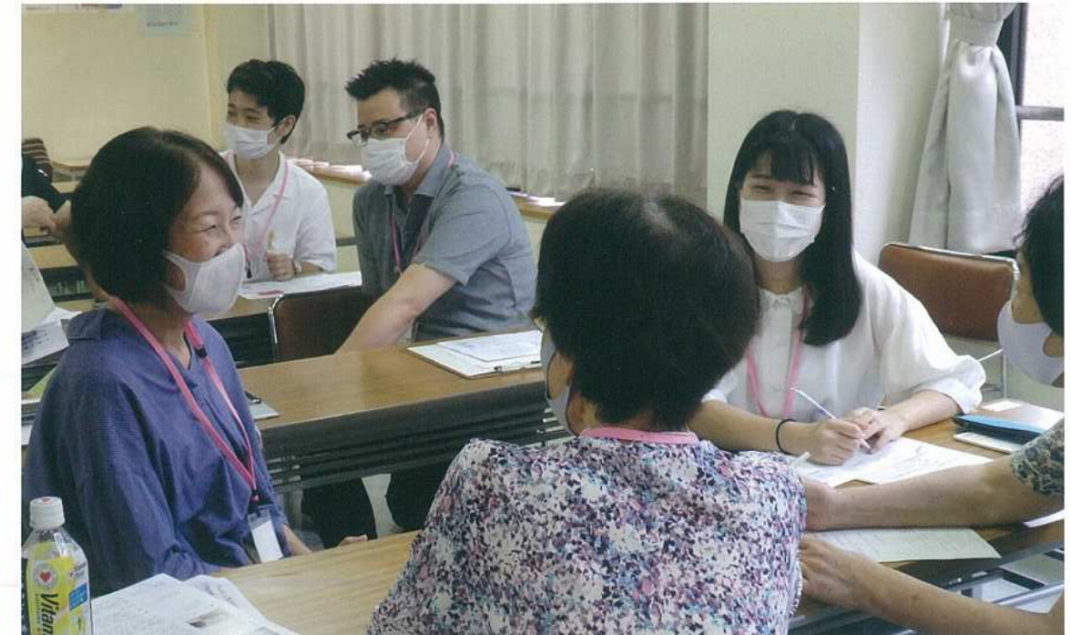
四街道市みんなで地域づくりセンターの講座風景