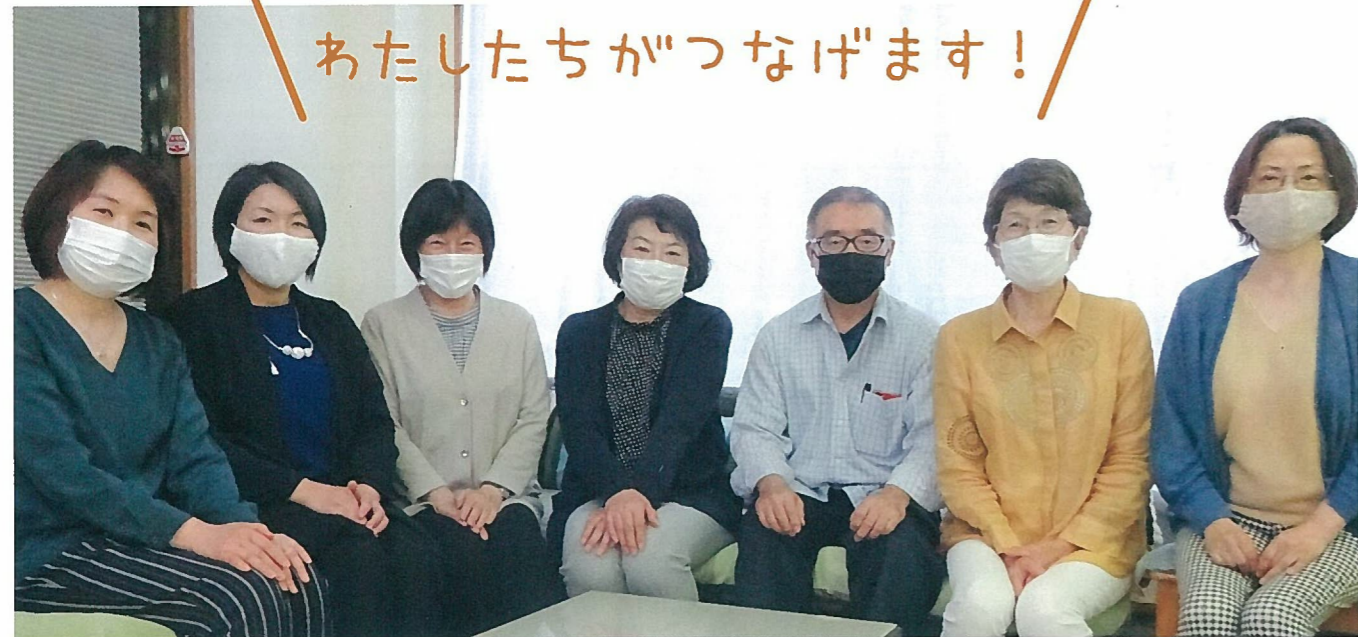
NPOクラブ事務局スタッフ

相談から広がる、つながる 様々な主体から寄せられる相談を、関連する情報や組織につないでいます。今年度の例を紹介します。